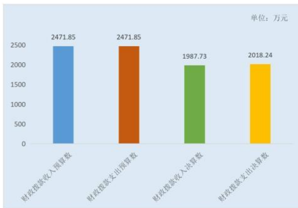
图 5：财政拨款收支预决算对比情况（单位：万元）

3. 国有资本经营预算财政拨款本年收入完成年初预算 0.0%，与上年持平，主要原因是我大队无国有资本经营预算财政拨款；支出完成年初预算 0.0%，与上年持平，主要原因是我大队无国有资本经营预算财政拨款。