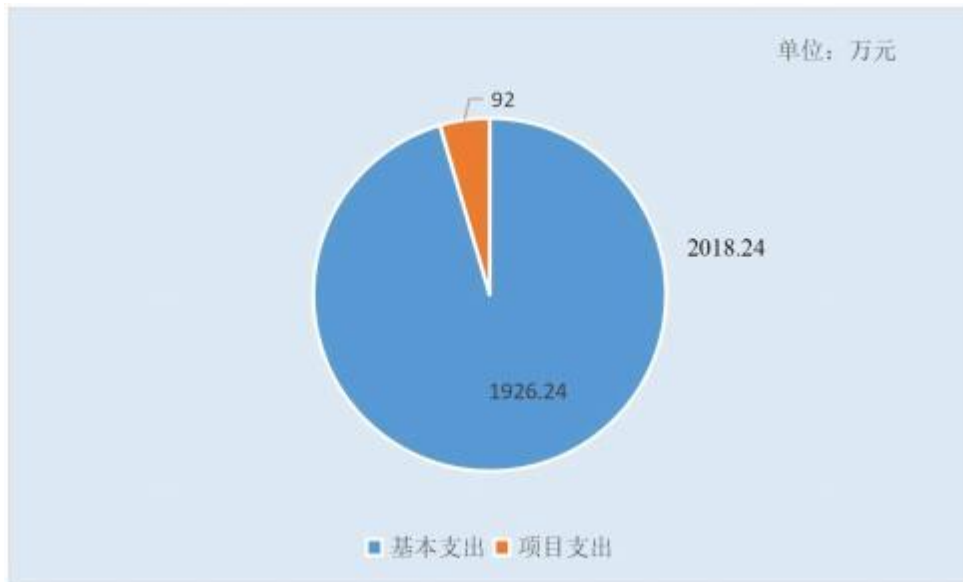
图 3：支出决算构成情况（按支出性质）

本部门 2021 年度支出合计 2018.24 万元，其中：基本支出 1926.24 万元，占 95.4%；项目支出 92 万元，占 4.6%；经营支出 0 万元，占 0.0%。