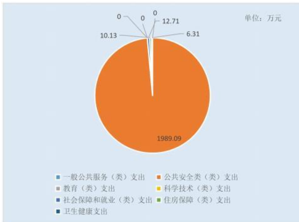
图 6：财政拨款支出决算结构（按功能分类）

2021 年度财政拨款支出 2018.24 万元，主要用于以下方面 一般公共服务（类）支出 0 万元，占 0.0%；公共安全类（类） 支出 1989.09 万元，占 98.6%，主要用于工资福利支出、商品服 务支出、对个人和家庭的补助、资本性支出等支出；教育（类） 支出 0 万元，占 0.0%，；科学技术（类）支出 0 万元，占 0.0%，； 社会保障和就业（类）支出 12.71 万元，占 0.6%；住房保障（类） 支出 10.13 万元，占 0.5%；卫生健康支出 6.31 万元，占 0.3%。