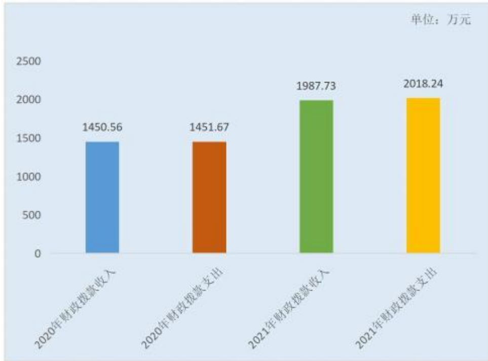
图 4：2020-2021 年度财政拨款收支情况（单位：万元）