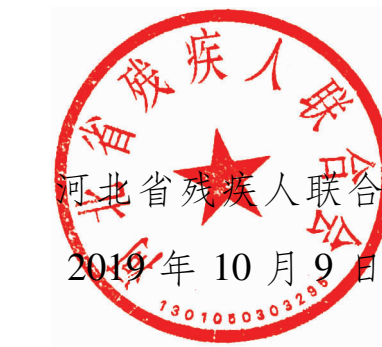
河北省残疾人联合会