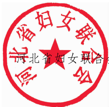
河北省妇女联合会