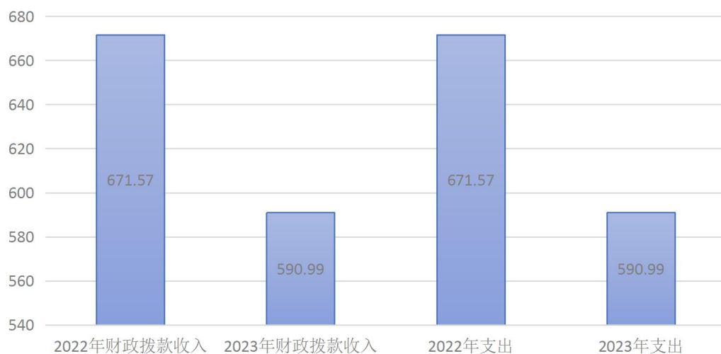
财政拨款收支与上年决算数对比图